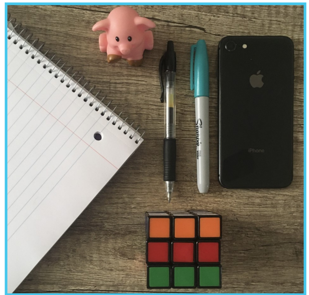
Objeto chico, utensilio para escribir, papel, linterna